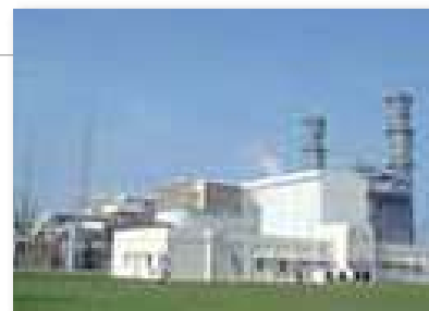
商業運転を開始したベトナム・フーミー3発電所

現在も九州電力（株）グループの海外進出に向けて、双日（株）と共同でワーク中です。