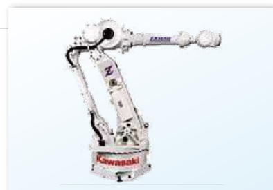
川崎重工業(株) 溶接ロボット

当社は双日マシナリー（株）と共に、トヨタ自動車九州（株）向け溶接/塗装ロボット（メーカー：川崎重工業（株））、ダイカストマシン（メーカー：宇部興産機械（株））の販売代理店を務めています。宮田工場・苅田工場・小倉工場での自動車生産の一翼を担っています。